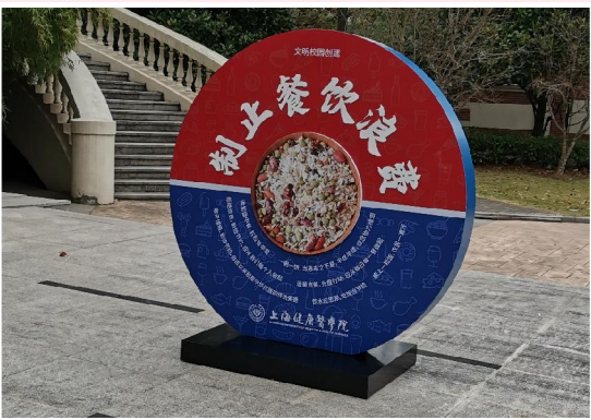
▲节约粮食,自觉行动