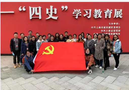
▲药学院党总支组织师生赴上海市浦东新区“守初心 担使命”——“四史”学习教育展