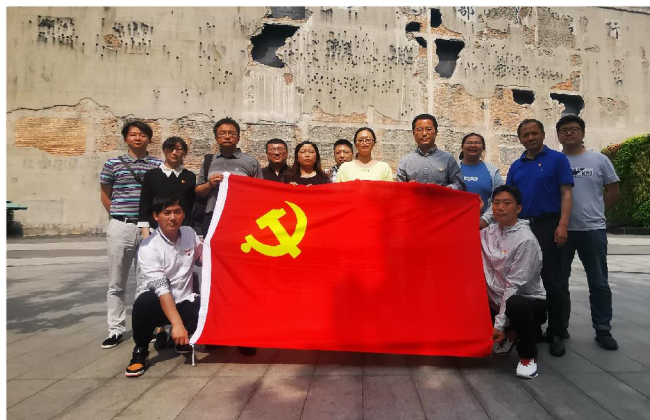
▲不忘历史,不忘初心——行政第二联合党支部全体参观四行仓库抗战纪念馆