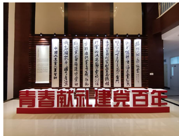
▲书法《中国共产党入党誓词》