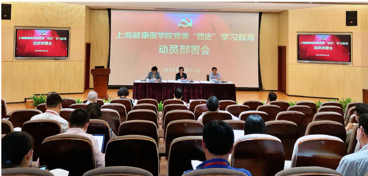
▲学校召开“四史”学习教育工作动员部署会