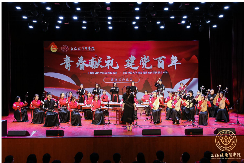
▲民族器乐合奏曲《青春向党·庆生》

【编者按】日前，学校举办了“学党史、强信念、跟党走”——纪念五四运动102周年主题活动暨五四表彰大会、“青春献礼 建党百年”上海健康医学院云和民乐团·上海师范大学锦瑟民族室内乐团联合专场讲座式音乐会、“青春献礼建党百年”书法展等系列活动。书法展中，师生用不同艺术手法讴歌党、讴歌祖国、讴歌人民、讴歌英雄，通过艺术作品感染力，润物无声地将师生们在党史学习中的体会、触动、共鸣传递给观众，从而做到学史明理、学史增信、学史崇德、学史力行；讲座式音乐会以民乐、舞蹈、声乐的表现形式讲述经典故事，感悟传统文化，探寻红色足迹，宣扬红色精神，帮助师生们深入理解民族艺术，传承民族文化，激发对党和国家的热爱，为党的百年大庆添彩！让我们一同来领略他们的风采吧。