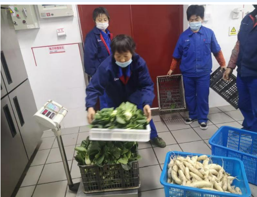
▲职工 精选自己种植的蔬菜,丰富学生伙食