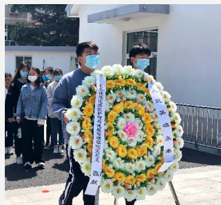
▲护管学院师生赴南汇烈士陵园祭奠英烈 ▲医械学院师生赴龙华烈士陵园祭奠英烈 ▲学工部、武装部师生赴龙华烈士陵园祭奠英烈