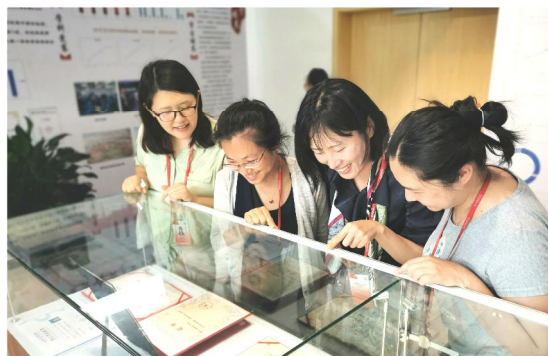
▲临床医学院组织师生党员参观学校建校五周年暨办学七十年医学人才培养回顾主题展