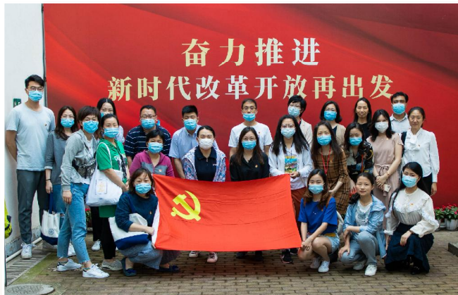
▲探浦东开发开放历程,学先辈创业拼搏精神——学工党支部参观浦东开发陈列馆