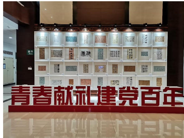
▲“青春献礼建党百年”书法展

【编者按】日前，学校举办了“学党史、强信念、跟党走”——纪念五四运动102周年主题活动暨五四表彰大会、“青春献礼 建党百年”上海健康医学院云和民乐团·上海师范大学锦瑟民族室内乐团联合专场讲座式音乐会、“青春献礼建党百年”书法展等系列活动。书法展中，师生用不同艺术手法讴歌党、讴歌祖国、讴歌人民、讴歌英雄，通过艺术作品感染力，润物无声地将师生们在党史学习中的体会、触动、共鸣传递给观众，从而做到学史明理、学史增信、学史崇德、学史力行；讲座式音乐会以民乐、舞蹈、声乐的表现形式讲述经典故事，感悟传统文化，探寻红色足迹，宣扬红色精神，帮助师生们深入理解民族艺术，传承民族文化，激发对党和国家的热爱，为党的百年大庆添彩！让我们一同来领略他们的风采吧。