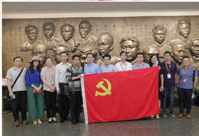
▲医疗器械学院党总支开展“四史”学习教育——参观中共一大会址