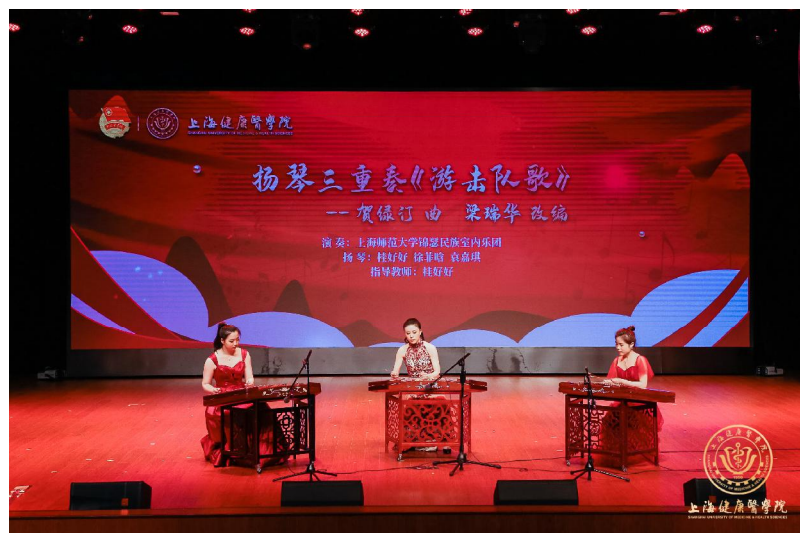
▲扬琴三重奏《游击队之歌》