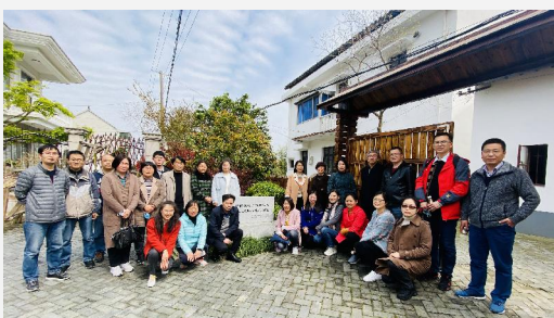
▲马克思主义学院全体教师参观新四军抗日游击纵队浦东支队驻扎地旧址

支,基础医学院直属党支部,外语国交联合直属党支部等走进龙华烈士陵园、南汇烈士陵园、松江烈士陵园、闵行区烈士陵园、金山区烈士陵园、淞沪抗战纪念馆、四行仓库抗战纪念馆等地,附属卫校学生科、团委组织全体留校学生前往上海宝山烈士陵园,祭奠英烈,以“实景党课”的形式重温真实历史,汲取奋斗力量,赓续共产党人的精神血脉。