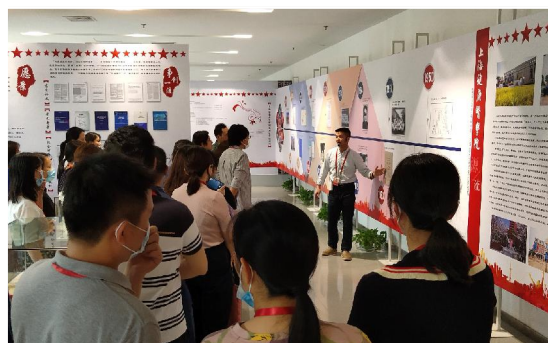
▲图文信息联合直属党支部、行政第一联合直属党支部联袂参观学校建校五周年暨办学七十年医学人才培养回顾主题展