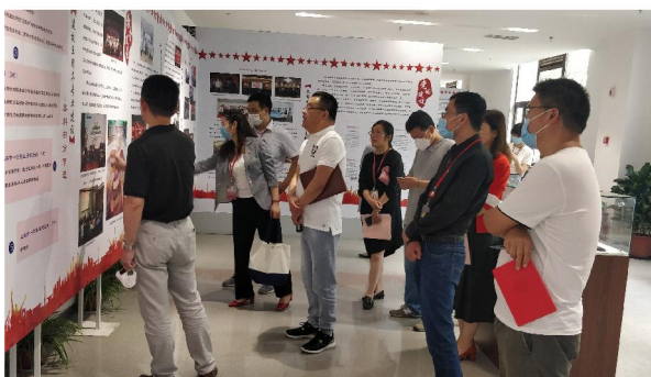
▲医学技术学院全体中心组成员参观学校建校五周年暨办学七十年医学人才培养回顾主题展