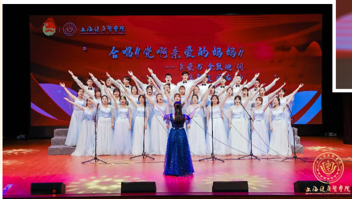
▲合唱《党啊亲爱的妈妈》