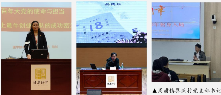
▲健康讲堂之党史分讲堂开讲 ▲健康讲堂李白烈士事迹专题讲座