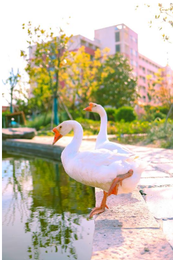
▲春江水暖 鹅先知 范婧怡