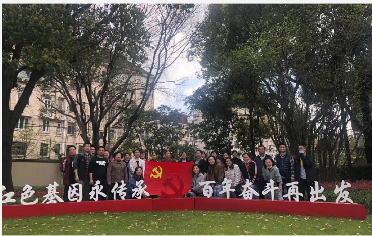
▲行政第一联合直属党支部组织教师赴复旦大学《共产党宣言》展示馆(陈望道旧居)