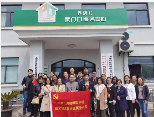
▲图文信息联合直属党支部组织教师参观“全国生态文化村”——周浦界浜村