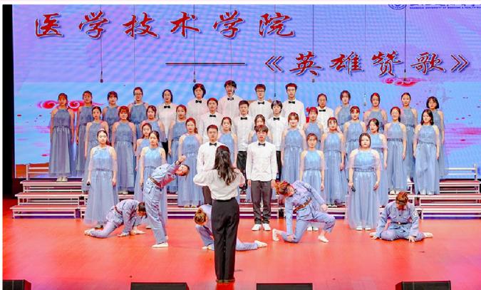
《英雄赞歌》 纪念“二·一九”运动85周年主题歌会节目